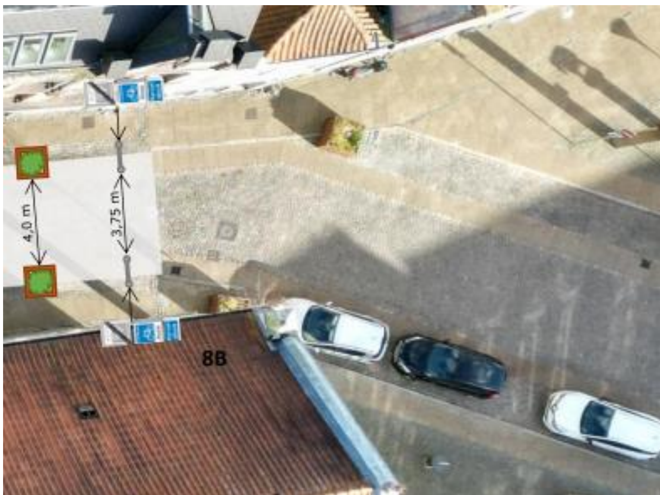
Udsnit af illustrationstegning: Forslag til indretning af Nørregade (bilag til Høring om forslag til ...)