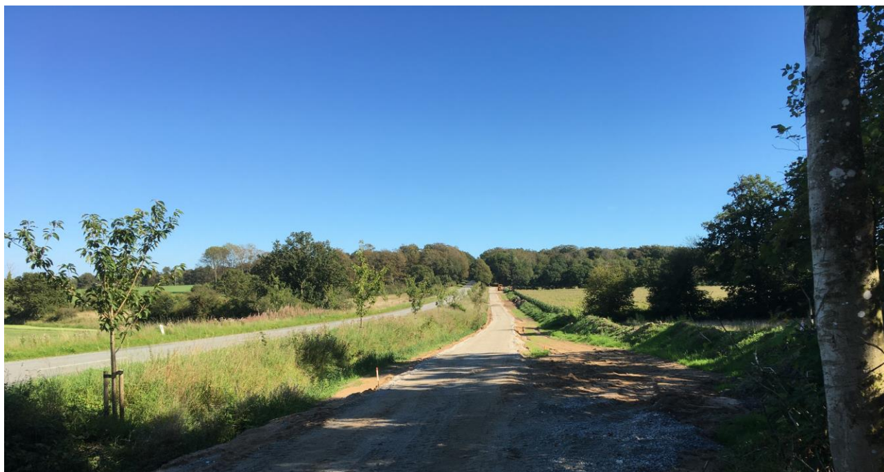
4. september 2023

Her er et par billeder mere fra den kommende sti: