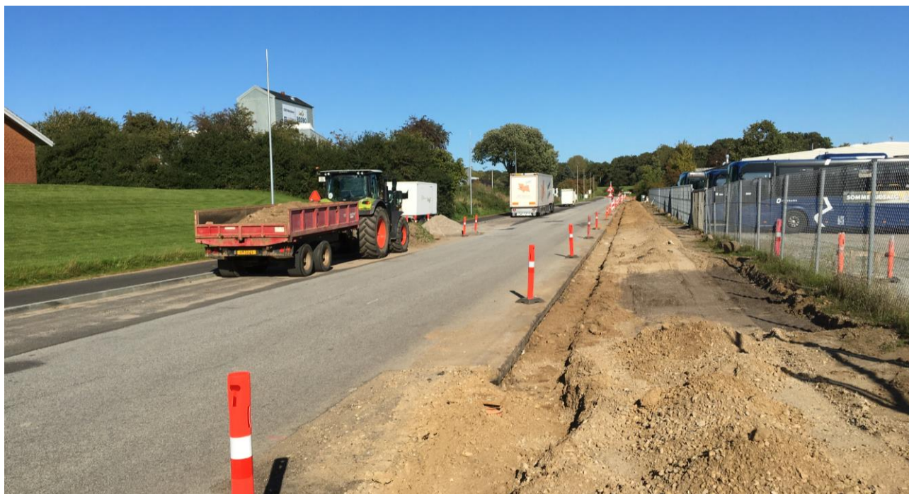
4.september 2023

På Norgesvej er stien på nordsiden stort set færdig. På sydsiden er arbejdet med indsnævring af bilkørebanen og etablering af kantsten og sti i fuld gang.