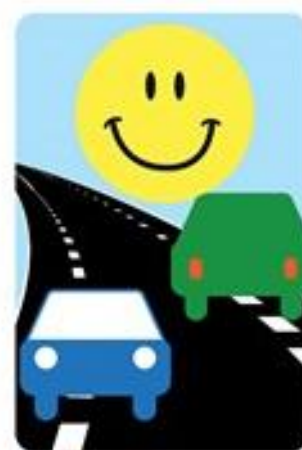
Skiltning på 2-1 vejene