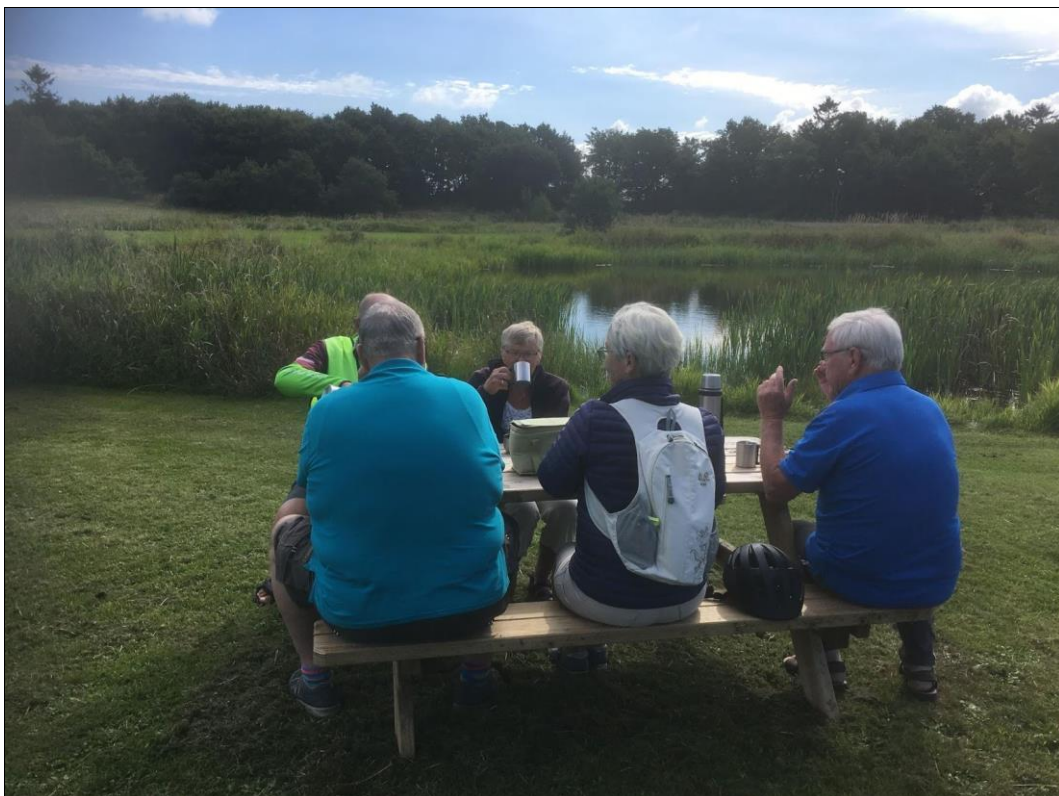
Kaffehygge i Møjboel mellem Øster Lindet og Stursboel.

Send evt. forslag til vita.vesterlindet@gmail.com