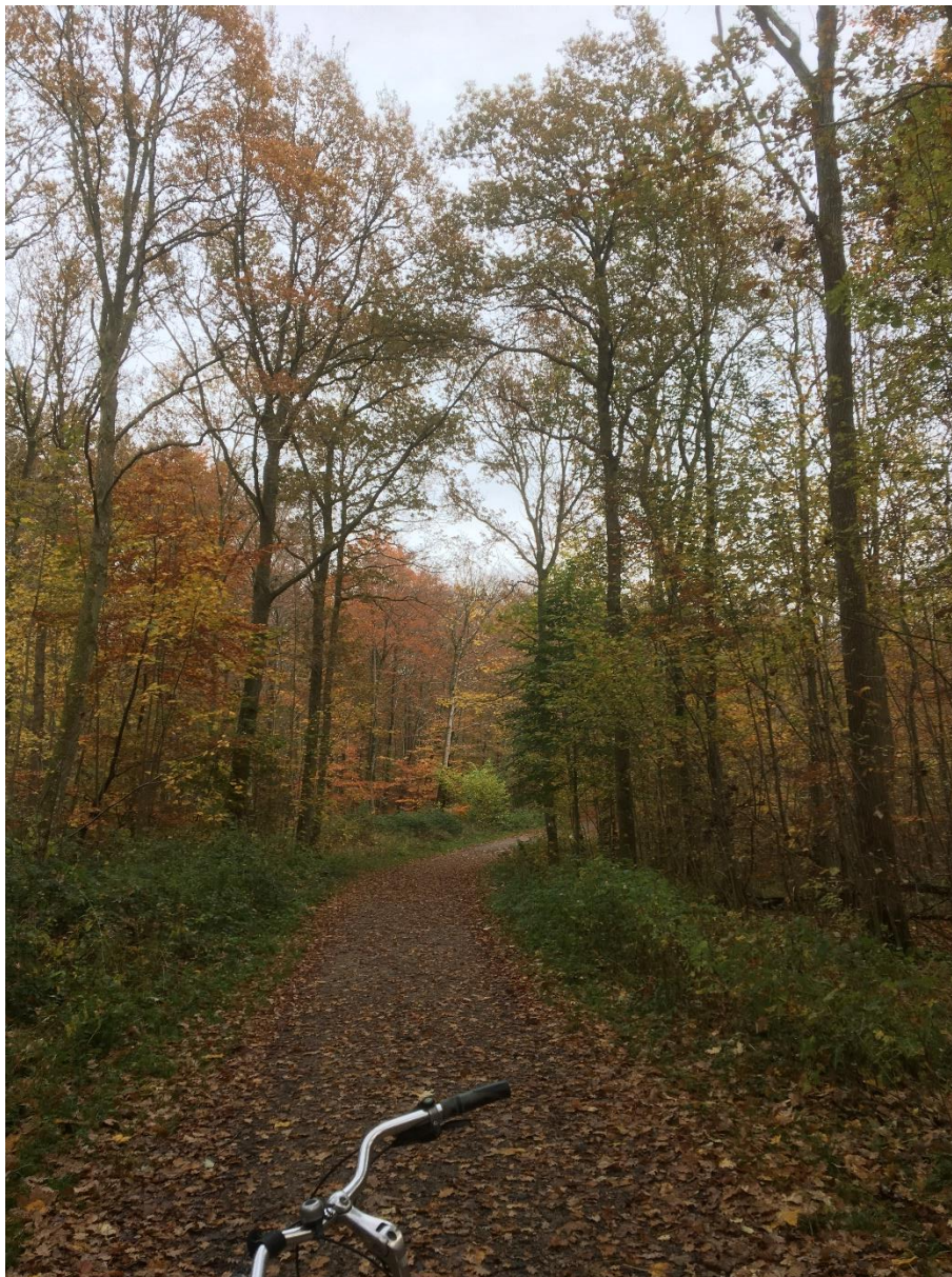
Vesterskoven 4.11.21

- og tænk lidt over lokalafdelingens fremtid