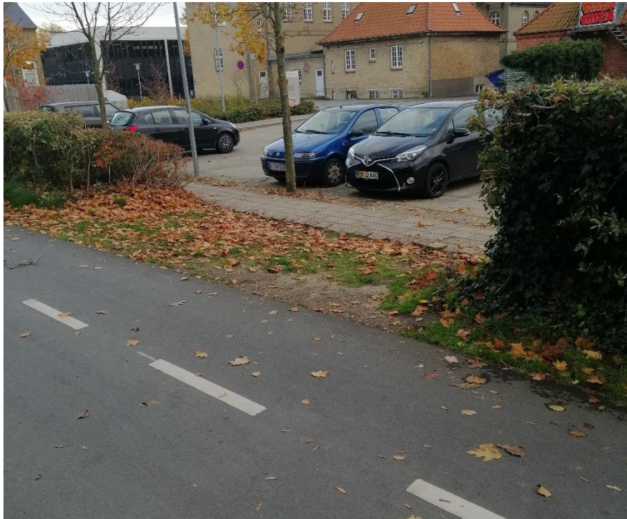
Der mangler genplantning her og der langs Banestien