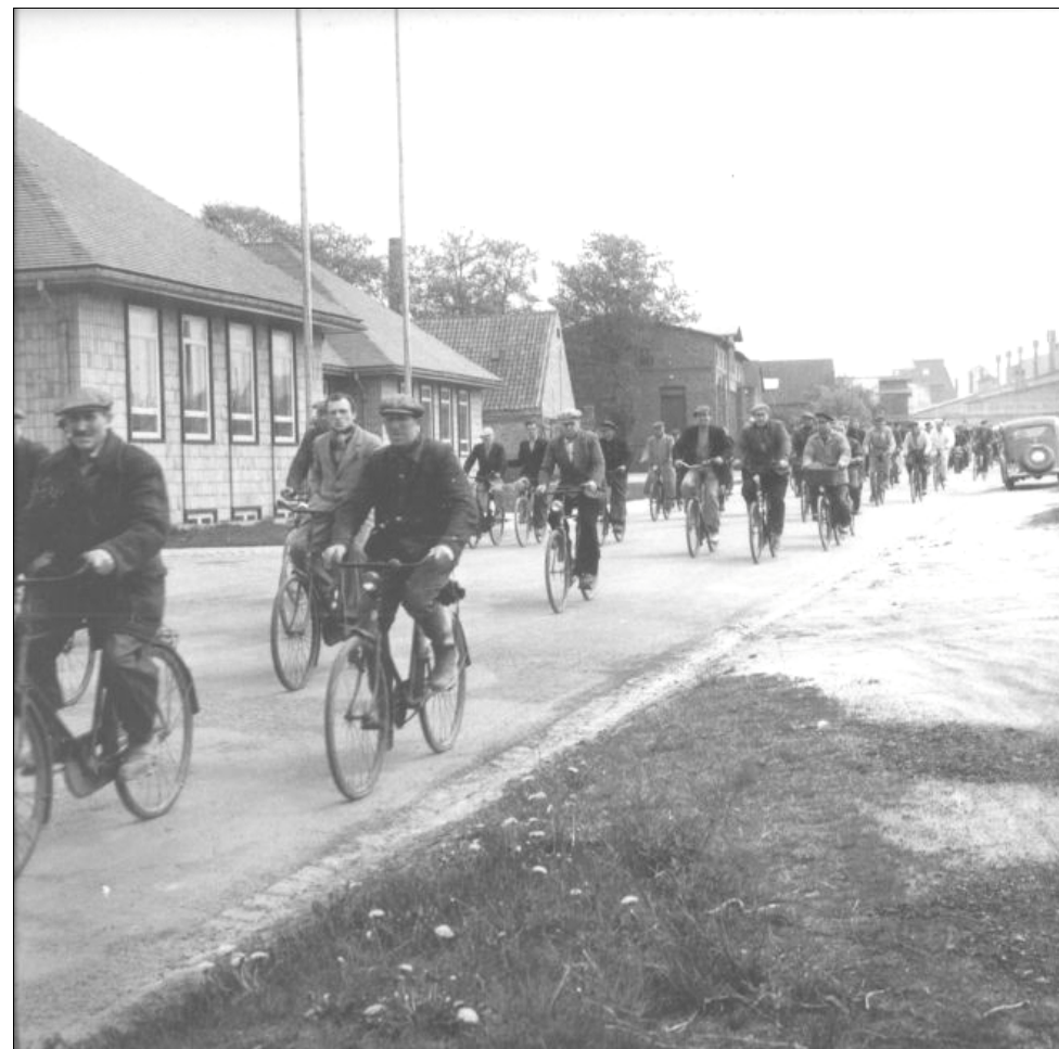
Fyraften på Rabækkeværket, ca. 1955