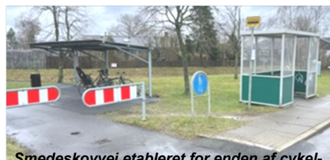
Smedeskovvej etableret for enden af cykel-

Silkeborgs tekniske forvaltning oplyser, at projekterne vil blive gennemført i år.