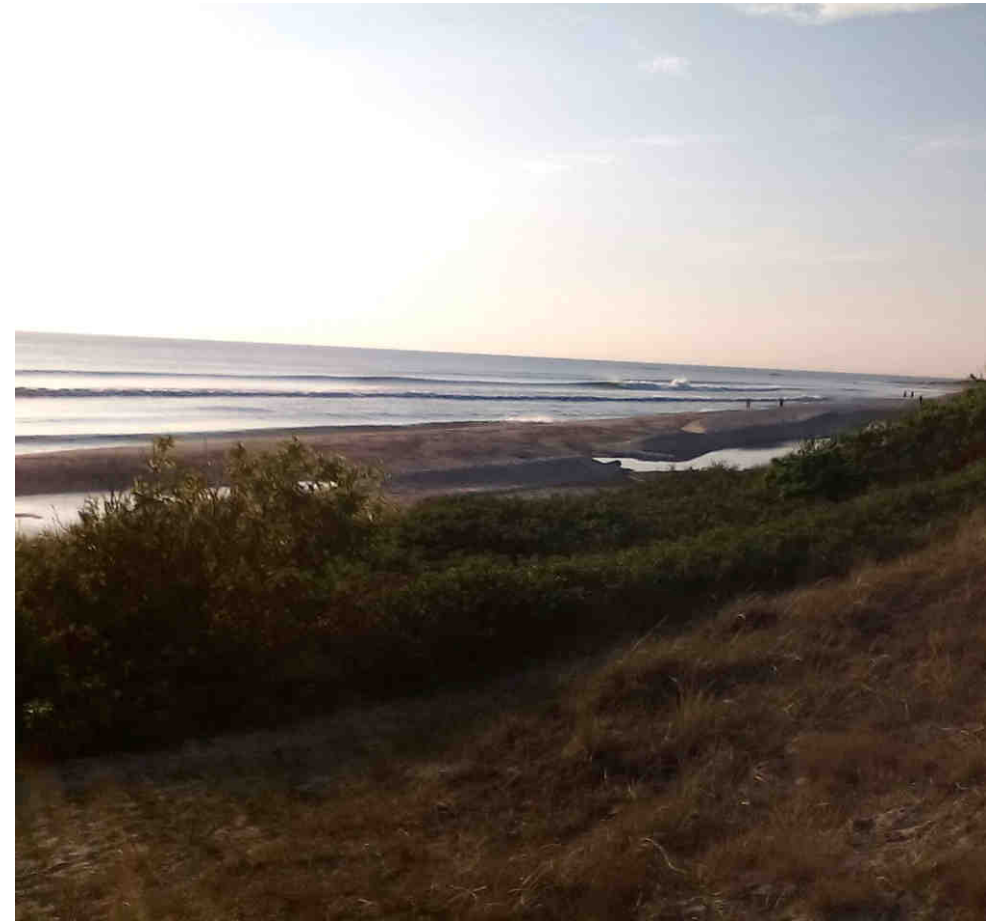
Mens vi holder kaffepause på onsdagsturen den 1. juni nyder vi denne udsigt.

arrangeres fra 2016 af Viking Atletik, der viderefører arrangementet i samme ånd som hidtil, dvs. uden tidstagning og med hyggelig sammenkomst efter løbet. Startsted og sammenkomst er fra i år Torneværksvej 20, Rønne. Cyklistforbundets medlemmer på Bornholm kan få startgebyret refunderet. Træningsturene mandage arrangeres af Viking som hidtil og med 4 hold. Se mere på www.cykelbornholmrundt.dk