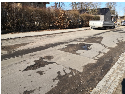
Dårlig belægning på Niverødvej ved Nivå Station

www.cyklistforbundet.dk/hf cyklistforbundet.hf@gmail.com