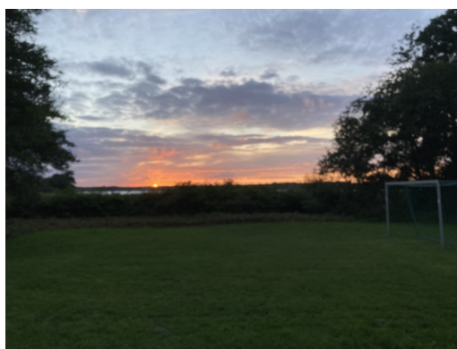
Solnedgang over Sjælsø ved en tidligere sensommeraftentur